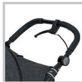
Optionale Ausstattung: Handbremse