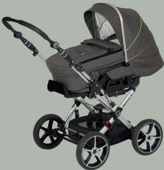
Topline X mit Kombitasche