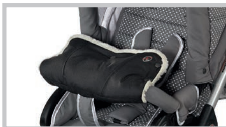
Handwärmer Mum + Kids