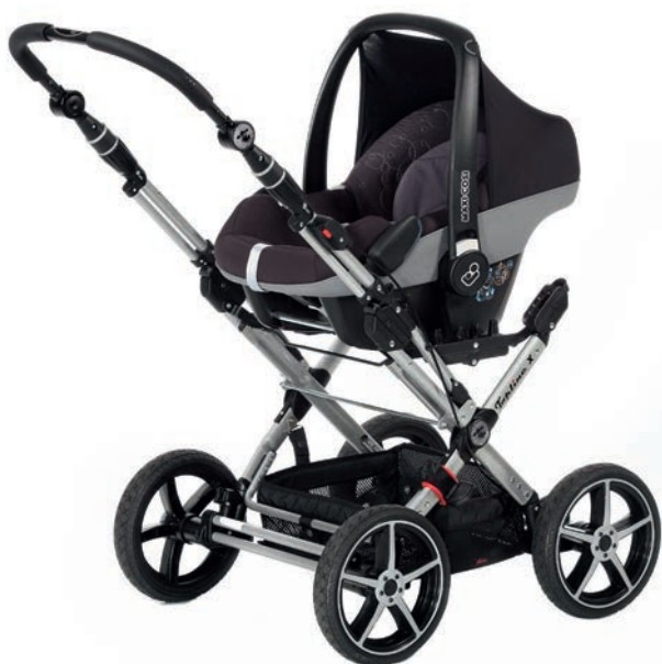
Topline X mit Autositz