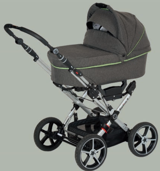
Topline X mit Falttasche